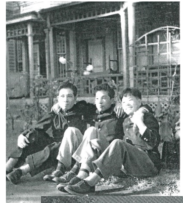
フレッシュマンの三人