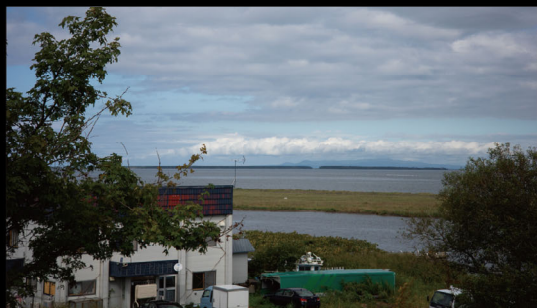
別海より国後を望む

●会場 = 明治学院大学白金キャンパス 2号館 2301教室 〒108-8636 東京都港区白金台1-2-37